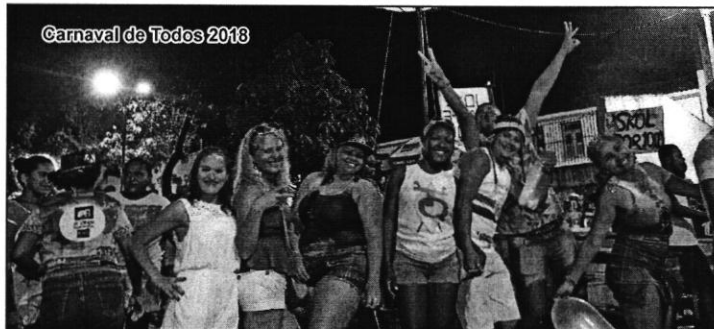
Carnaval de Todos 2018

Serão cinco dias intensos de programação nas ruas do Centro de São Luís e em todos os cantos do estado. Na programação oficial do Carnaval de Todos 2018, muita alegria, música, shows e segurança vão marcar presença.